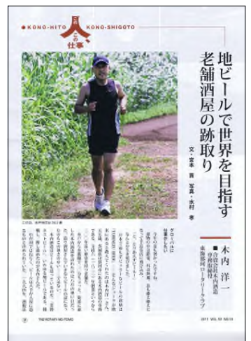
ロータリーの友(縦組P8)