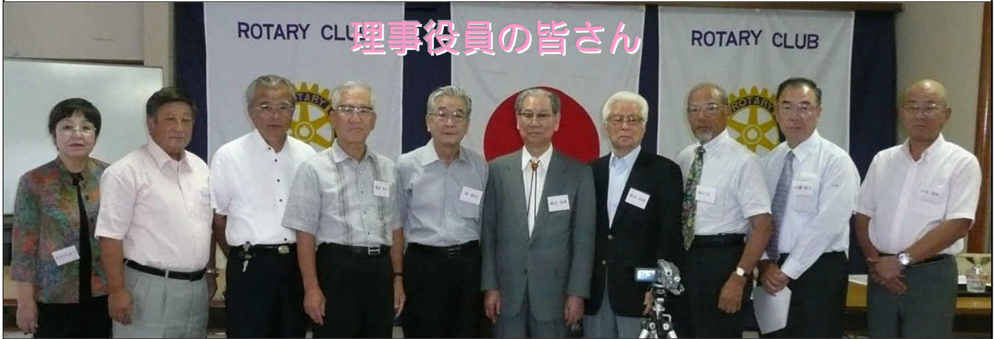
理事役員の皆さん